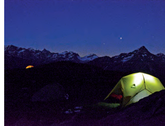
Notte stellata in Engadina

Le gite avranno luogo solo con condizioni meteo favorevoli.